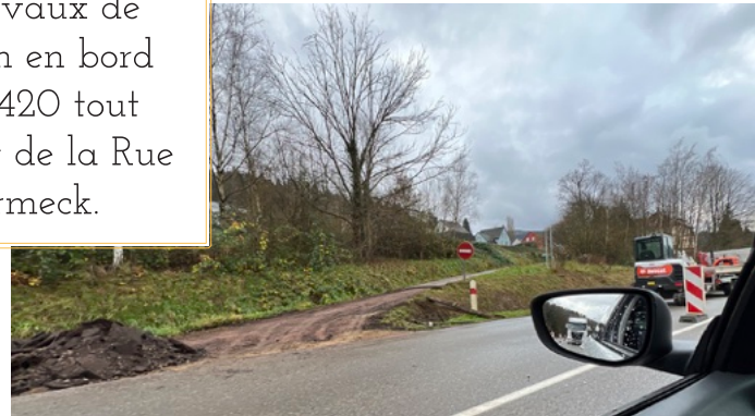
-Des travaux de réfection en bord de RD 1420 tout au bout de la Rue de Schirmeck.