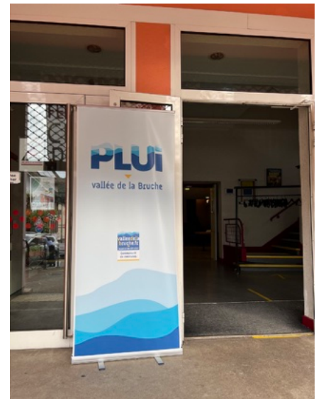
-Une première réunion consacrée au Plan Local d'Urbanisme Intercommunal se tenir au Royal. Une première plutôt technique.