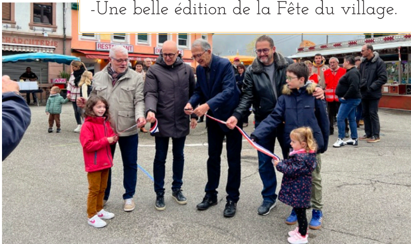
-Une belle édition de la Fête du village.