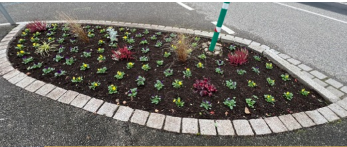
-Le fleurissement hivernal prendre sa place. L'occasion de ramasser des kilos de déchets qui devraient être dans les poubelles.