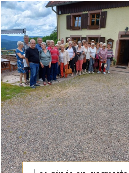
-Les aînés en goguette...